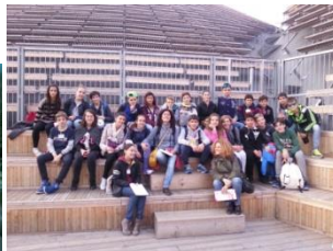
alcuni ragazzi delle classi terze